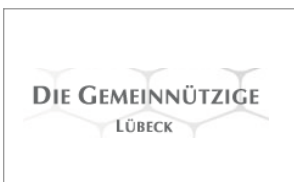
Gesellschaft zur Beförderung Gemeinnütziger Tätigkeit Königstraße 5, 23552 Lübeck