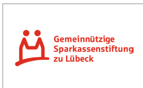
Sparkassenstiftung zu Lübeck Breite Straße 18-28 23552 Lübeck