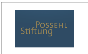
Possehl-Stiftung Lübeck Beckergrube 38-52 23552 Lübeck