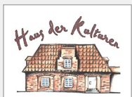
Haus der Kulturen